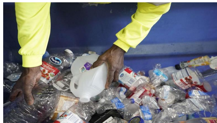
Affinage du tri.