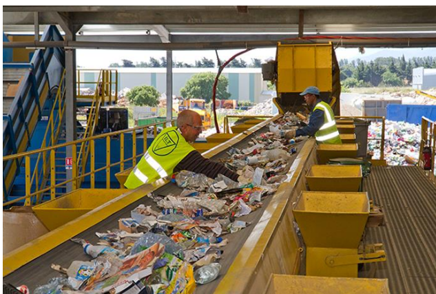
Après un tri mécanique, tri manuel par les agents.