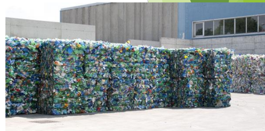
Mise en balle des matériaux pour un envoi aux centres de valorisation.